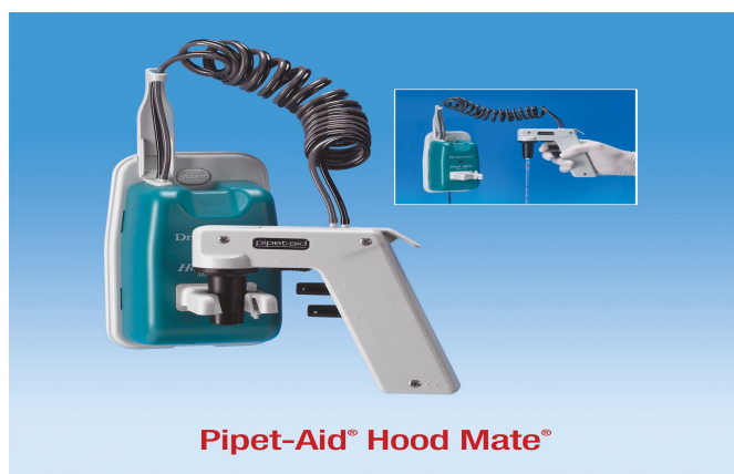
Pipet-Aid® Hood Mate®