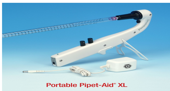
Portable Pipet-Aid® XL