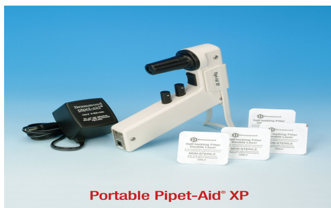
Portable Pipet-Aid® XP